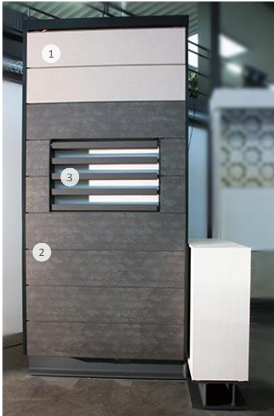
Vorderansicht Front elevation